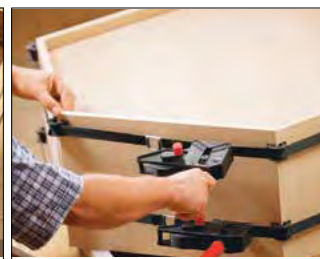
Serraggi con angolo da 60° a 180°