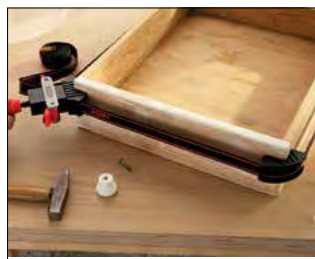
Serraggi ad angolo retto (90°)

Forniti con 4 pratici posizionatori angolari che consentono di coprire un'ampia gamma di applicazioni - Impugnatura adattabile per ambidestri