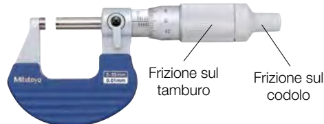
Frizione sul tamburo