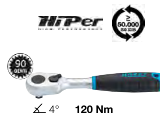
\angle 4° 120 Nm

Leva a "T" con attacco scorrevole - DIN 3122 - ISO 3315 - Lunghezza totale 115 mm